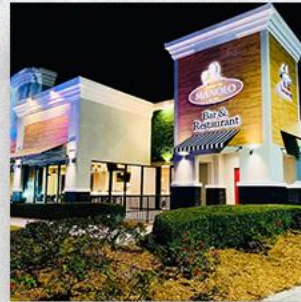
• Almoço com empresários no Boteco do Manolo