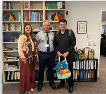
• Reunião com SECOM