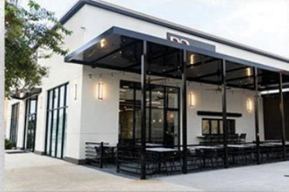
• Almoço com empresários no BR77