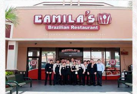
• Jantar com empresários no Camila's