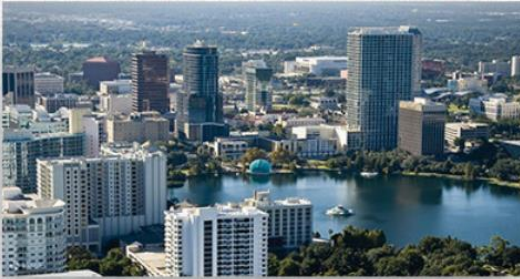
• City Tour em Orlando