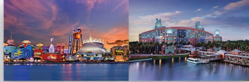
• Visita ao Disney Springs e resorts da Disney