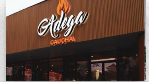
• Jantar com empresários no Adegas Gaúchas;