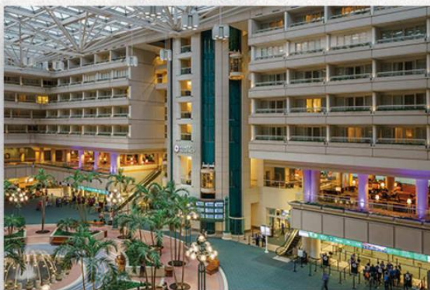
• Chegada em Orlando