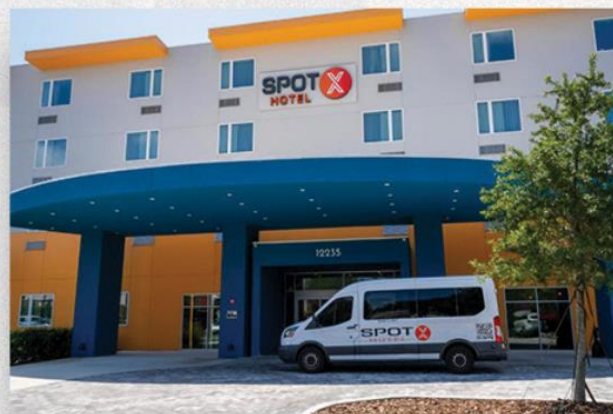
• Traslado para o Hotel Spot X