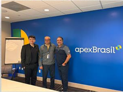
• Reunião com Apex Brasil