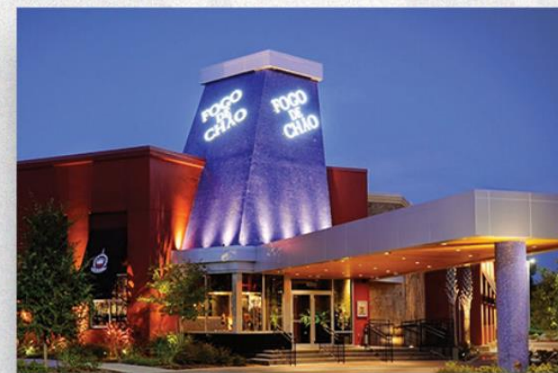
• Jantar de boas-vindas no Fogo de Chão com líderes empresariais