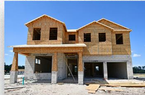
• Visita a empreendimentos de brasileiros